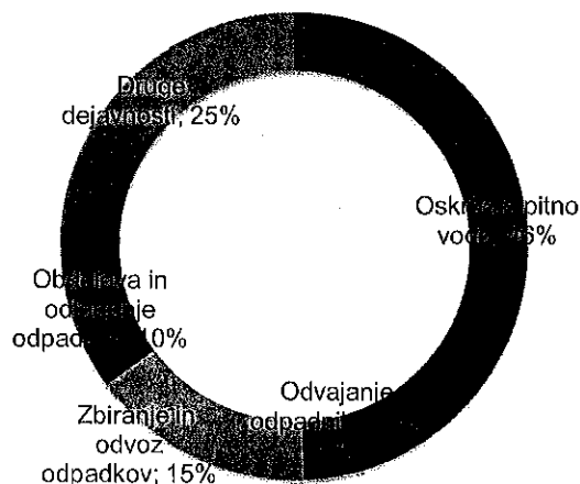
GRAF 47: STRUKTURA PRIHODKOV 2015

Spodnji graf prikazuje strukturo doseženih prihodkov v letu 2015 v občini Škocjan, iz katere je razvidno, da je največji delež ustvarjenih prihodkov na dejavnosti oskrbe s pitno vodo (46 %).